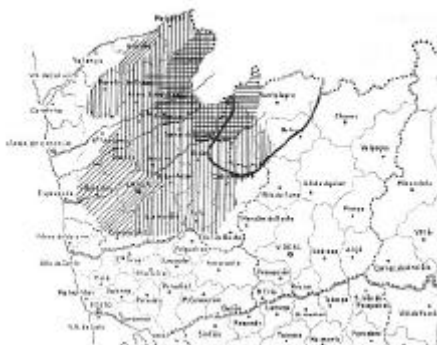
Figura 1. Solar e área de criação da raça.

La conservación de la raza bovina Barrosã contribuye a la fijación de poblaciones en zonas de recursos escasos, en virtud de su elevado potencial productivo.